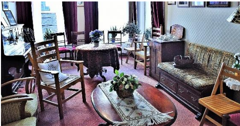
Foto 2. De woonkamer op de eerste verdieping waar het altijd gezellig was.

De bezichtiging van het Corrie ten Boomhuis begint in de woonkamer op de eerste verdieping, boven de voormalige winkel. Het is een knusse kamer, ingericht in de stijl van de jaren veertig. Donkere houten meubels zijn bekleed met een kleurig patroontje, er staan ouderwetse schemerlampen en veel planten sieren de vensterbank. Vooral het grote aantal stoelen en de foto's aan de muur vallen op: het geeft aan hoeveel mensen hier onderdak vonden tijdens de Tweede Wereldoorlog. "In totaal zijn er honderden mensen in dit huis geweest". "Sommigen maar voor een paar uur. Dan schoren ze snel hun baard eraf en blondeerden ze hun haar, om met een nieuwe identiteit weer de straat op te gaan."