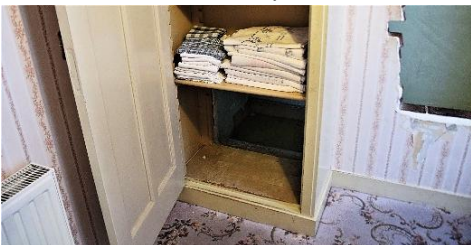
Foto 4. Door dit gat onderin de kast kroepen de onderduikers in de geheime ruimte

De volgende locatie is De Schuilplaats zelf. Daarvoor moeten we de smalle steile trap op naar het slaapkamertje van Corrie. De Schuilplaats is een ruimte achter een valse wand van het kamertje. We zien een groot gat in de wand waar je nu doorheen kunt stappen; in de Tweede Wereldoorlog moesten de onderduikers echter door een klein luik onder in de kast in De Schuilplaats zien te kruipen. Wij stappen voor het gemak door het grote gat in het hokje, dat niet groter is dan twee vierkante meter. Hoe bijzonder dat hier mensen zich verstopten, terwijl de nazi's door het huis liepen!