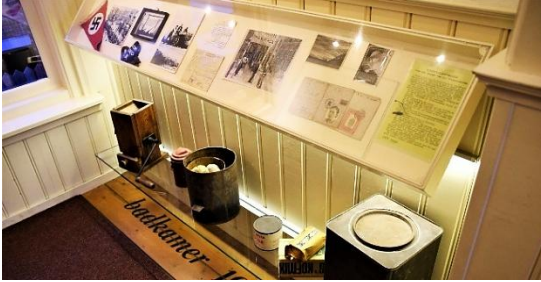
Foto 6. De oorspronkelijke slaapkamertjes vormen nu een expositieruimte.

In de overige slaapkamertjes, waar exposities zijn ingericht, zijn de muren uitgebroken, zodat ze nu één ruimte vormen. In de vitrines van het eerste kamertje zien we foto's en krantenartikelen en er liggen enkele voorwerpen uit de jaren veertig. Ook een rood vlaggetje met het hakenkruis heeft een plek gekregen. In deze ruimte geeft men een algemeen beeld van de Tweede Wereldoorlog.