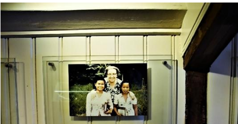
Foto 8. Na de Tweede Wereldoorlog trok Corrie ten Boom over de hele wereld met het evangelie

In het concentratiekamp bleven Betsie en Corrie geloven in God en vertelden ze hun medegevangenen over de liefde van Jezus. Na de oorlog is Corrie de wereld rondgetrokken met het evangelie. In ruim dertig jaar bezocht ze zestig landen! Altijd met dezelfde geruite koffer. Eén van de ruimtes gaat over haar leven na de oorlog. Er liggen brieven in de vitrines en er hangen allerlei foto's aan de muur.