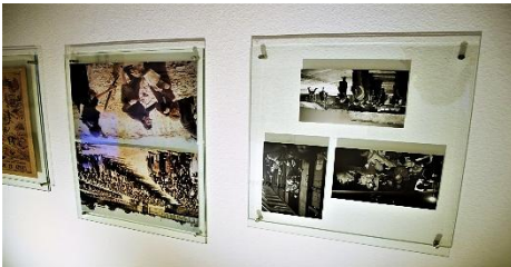
Foto 7. Een beeld van het leven in de concentratiekampen.

vermoord per Europees land - variërend van bijna 2.000 in Luxemburg tot 3 miljoen in Polen. De foto's aan de muur, de meeste uit de verfilming van De Schuilplaats, laten zien hoe verschrikkelijk het was in de concentratiekampen. Corries zus Betsie heeft de oorlog niet overleefd; Corrie werd vanwege een foutje in de administratie vrijgelaten.